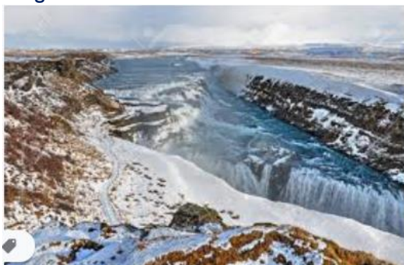
Chutes de Gullfoss

Petit déjeuner buffet. Route pour la région du Cercle d'Or. Arrêt à Gullfoss , qui signifie la "chute d'or". À Geysir, admirez le spectacle du geyser, le Strokkur , qui jaillit à 30 m toutes les 5 à 8 min. Enfin, Thingvellir** , site historique et géologique d'importance majeure. Une faille longue de plusieurs kilomètres et haute de plus de 30 m parcourt le site. Elle est le signe visible de la séparation entre les plaques tectoniques européenne et américaine. C'est aussi le lieu où peu après l'installation des premiers Vikings au 10 e siècle se tint une assemblée d'hommes libres se réunissant chaque année au solstice d'été. Au cours de la journée, détendez-vous dans les eaux chaudes et relaxantes du Secret Lagoon à Fludir ou du Fontana Spa à Laugarvatn. Nuit dans la région de Borgarnes.