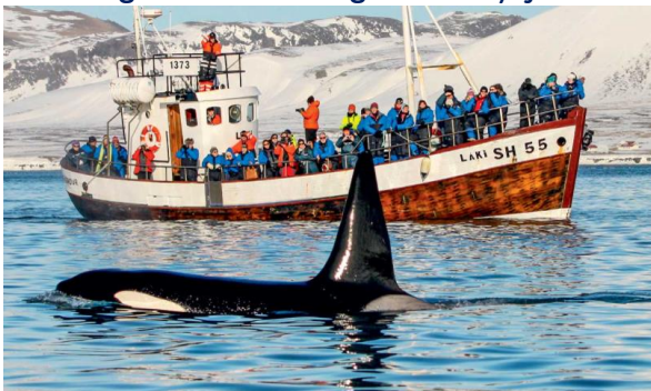
Croisière à la recherche des orques

Petit déjeuner buffet. Départ le matin pour une croisière (incluse- 2h) dans un fjord afin d'assister au spectacle des orques faisant la chasse aux harengs. Envie de goûter du requin faisandé ? Rendez-vous à la ferme de Bjarnarhöfn près de Stykkishólmur. Poursuite vers Reykjavík. En chemin, arrêtez-vous aux colonnes de basalte de Gerðuberg et au volcan éteint d'Eldborg. Nuit dans la région de Reykjavík.