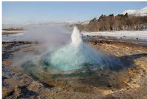
Geyser de Strokkur