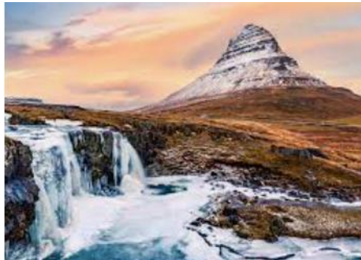
cascade de Kirkjufellsfoss