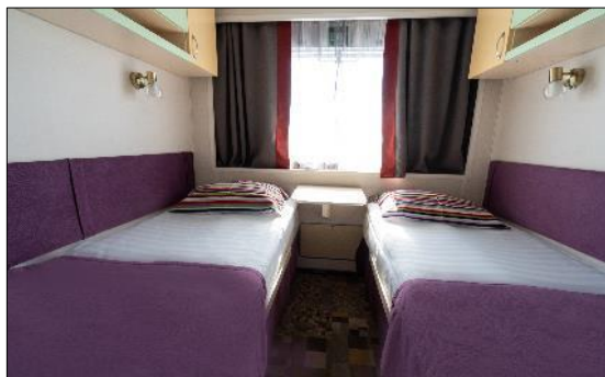
Cabine Confort B2, B1

Le M/S Kandinsky Prestige compte une centaine de cabines. Les Junior Suites ont une superficie de 18 m 2 , les cabines Confort de 9 m 2 réparties sur 3 ponts. Entièrement redécorées, équipées de deux lits bas, d'une TV écran plat, d'un coffre-fort et d'un sèche-cheveux, elles offrent tout l'espace et le confort que l'on peut attendre d'un bateau de croisière fluviale. Toutes extérieures, elles possèdent de larges fenêtres ouvrantes. Les salles de bain, rénovées avec des matériaux clairs et lumineux, sont pourvues d'une douche, d'un lavabo et d'un WC.