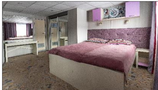
Cabine Junior Suite A2, A1