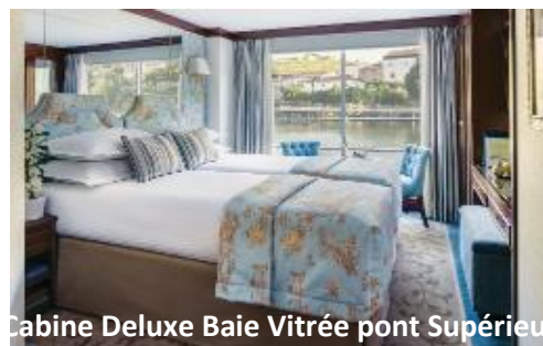
Cabine Deluxe Baie Vitree pont Supérieur