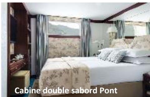
Cabine double sabord Pont

Les Suites Balcon disposent en outre d'un coin salon.