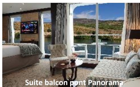
Suite balcon pont Panorama