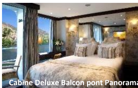
Cabine Deluxe Balcon pont Panorama