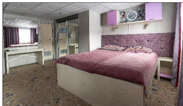
Cabine Junior Suite A2, A1